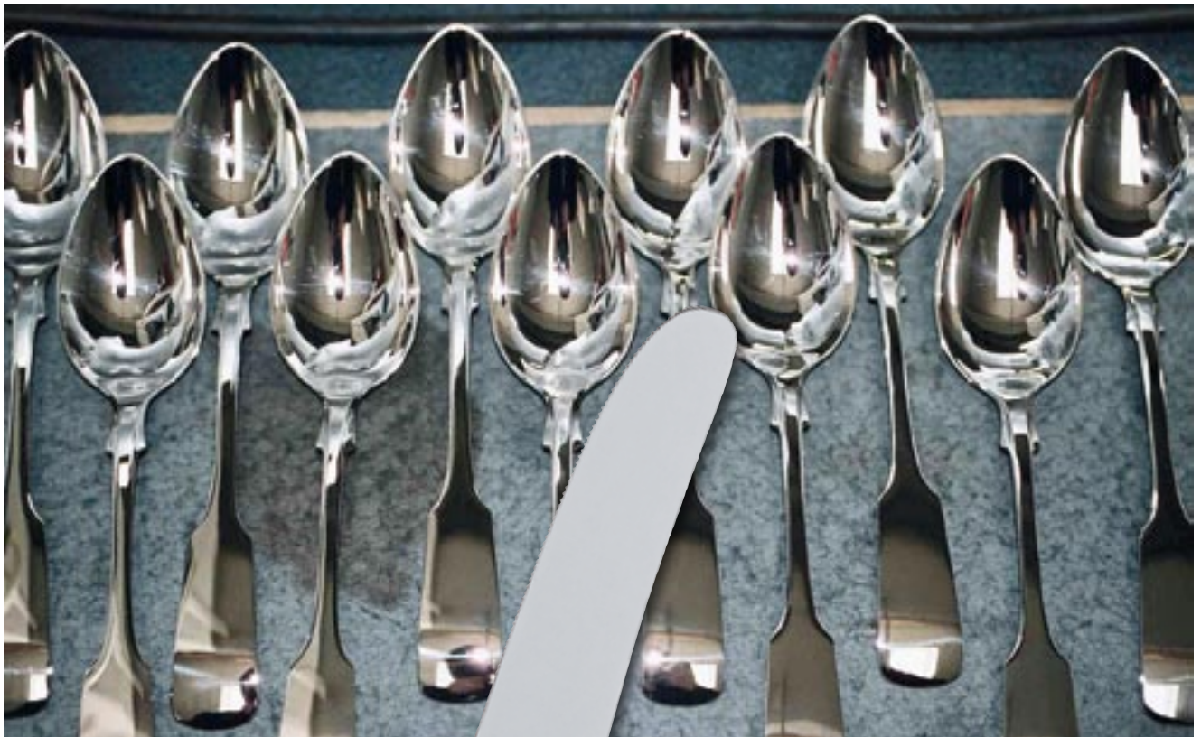
Ein Brett mit Kaffeelöffeln des „Spatens“ wartet nach