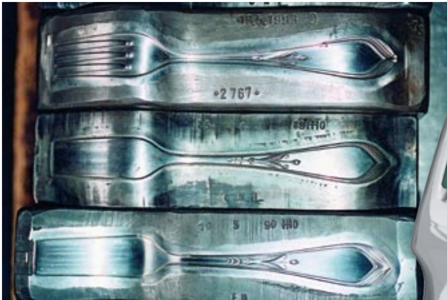
Prägewerkzeuge für die „Bremer Lilie“ – das Jubiläumsbesteck aus dem Jahr 1900 von Koch & Bergfeld – warten auf ihren Einsatz

Die Besteckmanufaktur von Koch & Bergfeld ist die bekannteste Lieferantin der großen Klassiker